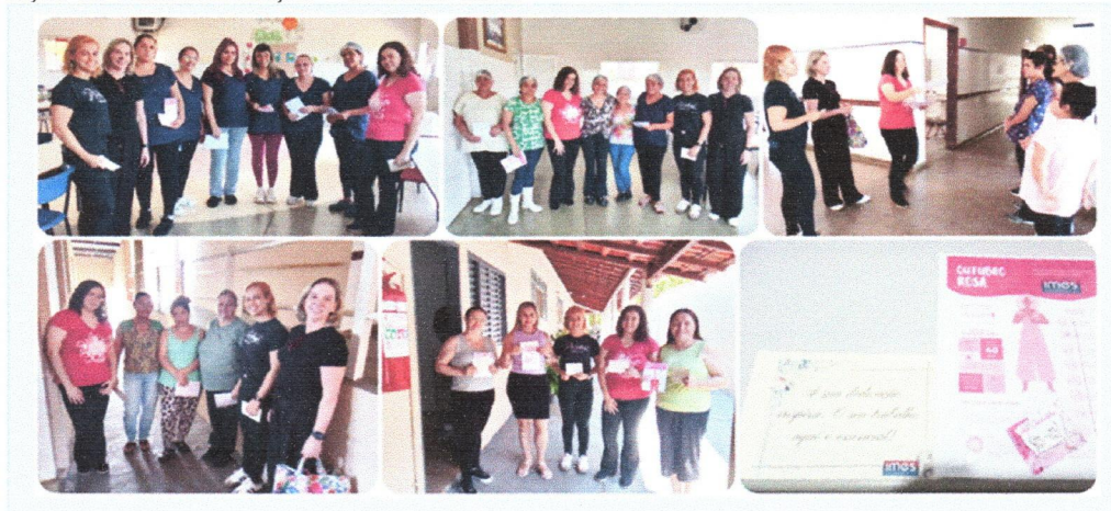
Igreja Congregação Cristã no Brasil