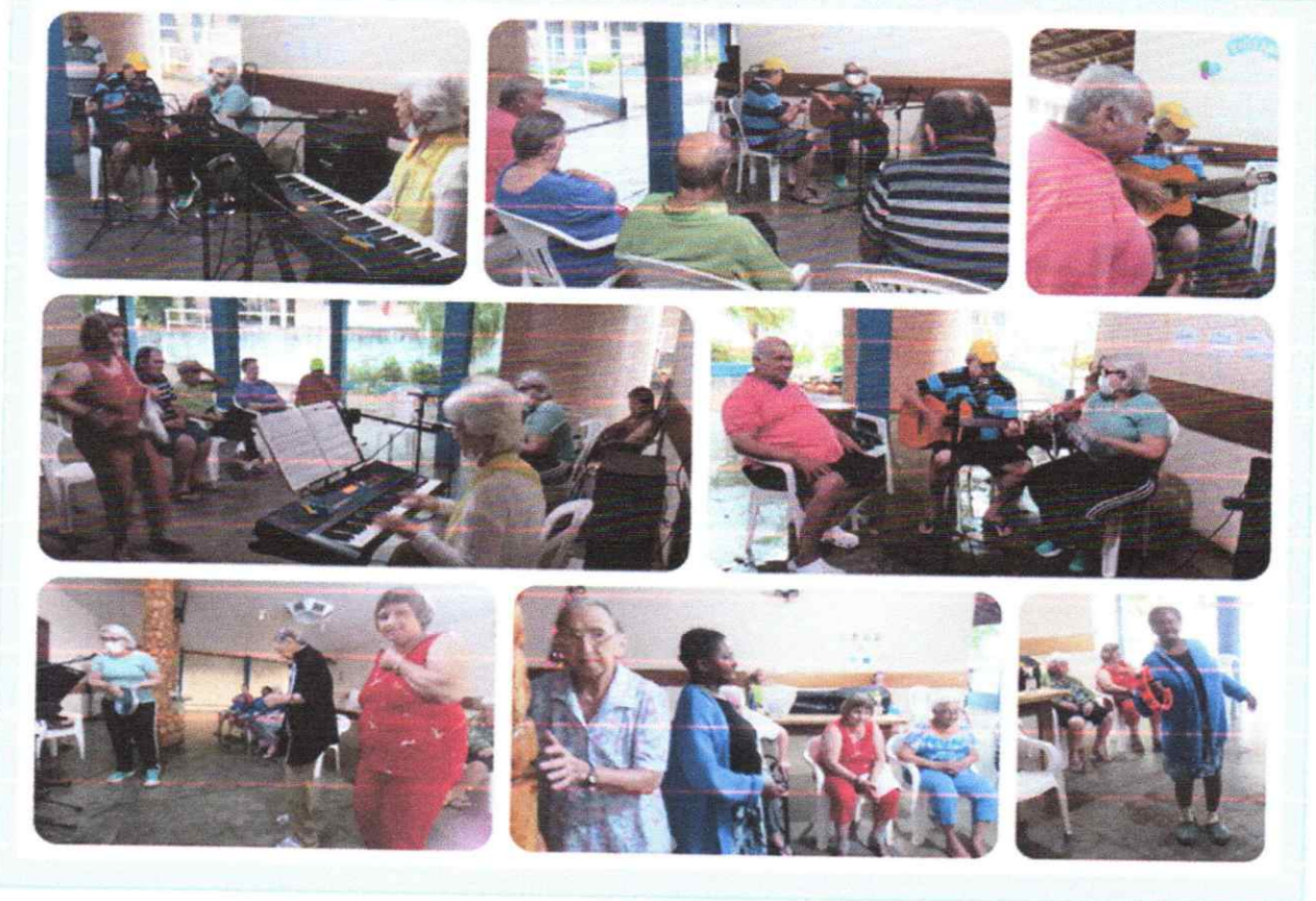
Tema: Projeto Alegria Musical e confraternização de aniversário de residentes por voluntárias / Data realizada: 14/12/2022.

Inscrita no Conselho Municipal de Assistência Social (CMAS) nº 001 de 24 de abril de 2018 Certificado de Regularidade Estadual nº CRCE 1875/2012 Certificado de Utilidade Pública Federal – D.O.U. em 20 de janeiro de 2013 CNPJ 51.843.969/0001-65