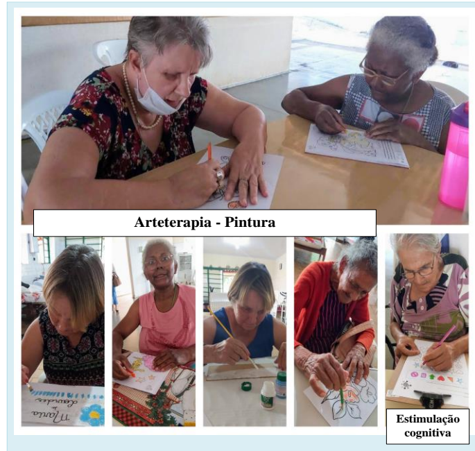
Arteterapia - Pintura

Inscrita no Conselho Municipal de Assistência Social (CMAS) nº001 de 24 de abril de 2018 Certificado de Regularidade Estadual nº CRCE 1875/2012 Certificado de Utilidade Pública Federal – D.O.U. em 20 de janeiro de 2013 CNPJ 51.843.969/0001-65