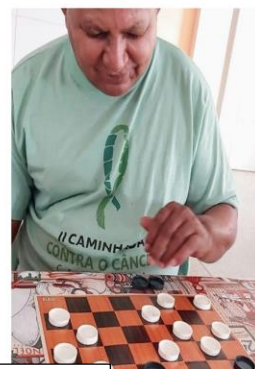
Jogos de Mesa