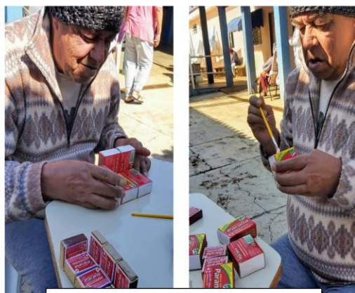
Resgate de atividades