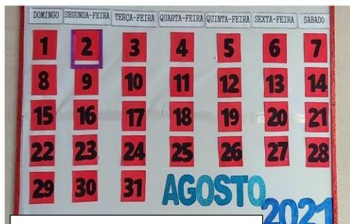
Confecção de painéis