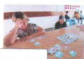
Jogo "quem eu sou?"