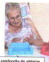
Arteterapia - confecção de objetos a partir de recicláveis e pintura.