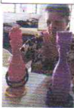
Dupla Tarefa Motor-Cognitivo.