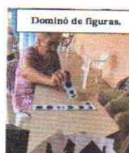
Dominó de figuras.