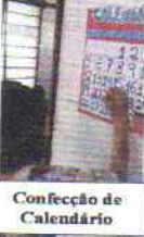
Confeção de Calendário