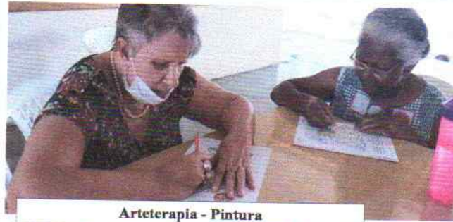
Arteterapia - Pintura

Tema: Atendimento de T. O. / Data realizada: De segunda a sexta-feira durante o mês de SETEMBRO.