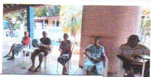
Jogo de bola