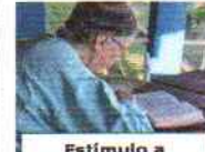
Estímulo a espiritualidade