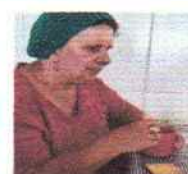
Treino de atividade diária