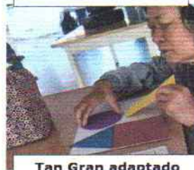
Tan Gran adaptado