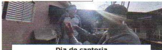
Dia de cantoria