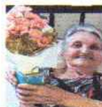
Confec. Vaso e porta retrato