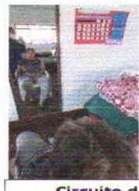
Circuito de exercícios