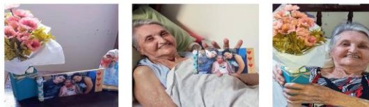
Confec. Vaso e porta retrato