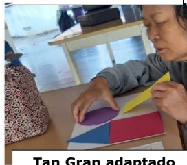
Tan Gran adaptado