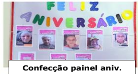
Confeção painel aniv.