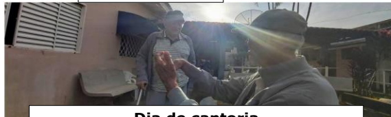
Dia de cantoria