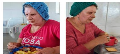
Treino de atividade diária