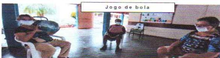
Jogo de bola