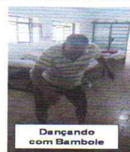
Dançando com Bambole