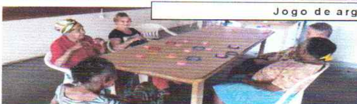
Jogo de argolas adaptado