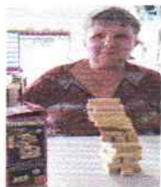
Torremoto e Pareamento de peças conforme o desenho