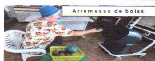
Arremesso de bolas