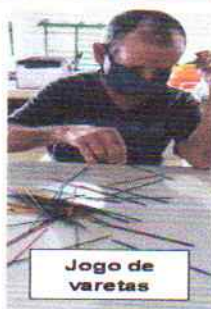
Jogo de varetas