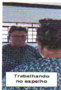
Trabalhando no espelho