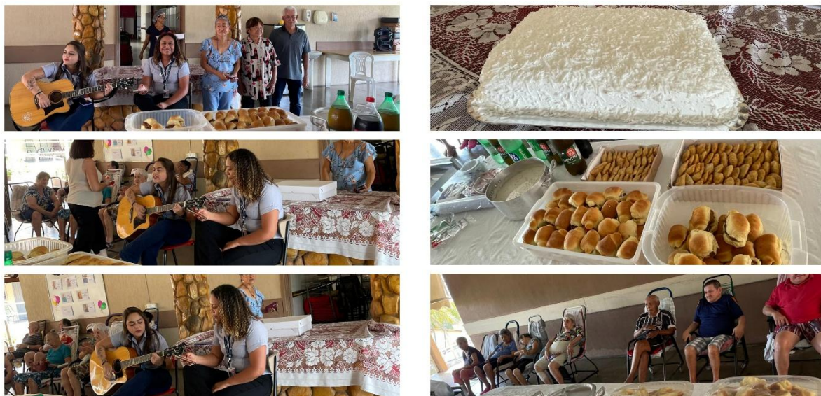
c) Atividade: Integração Comunitária – Lanche Especial Oferecida pelo Projeto Social Alegria do Riso