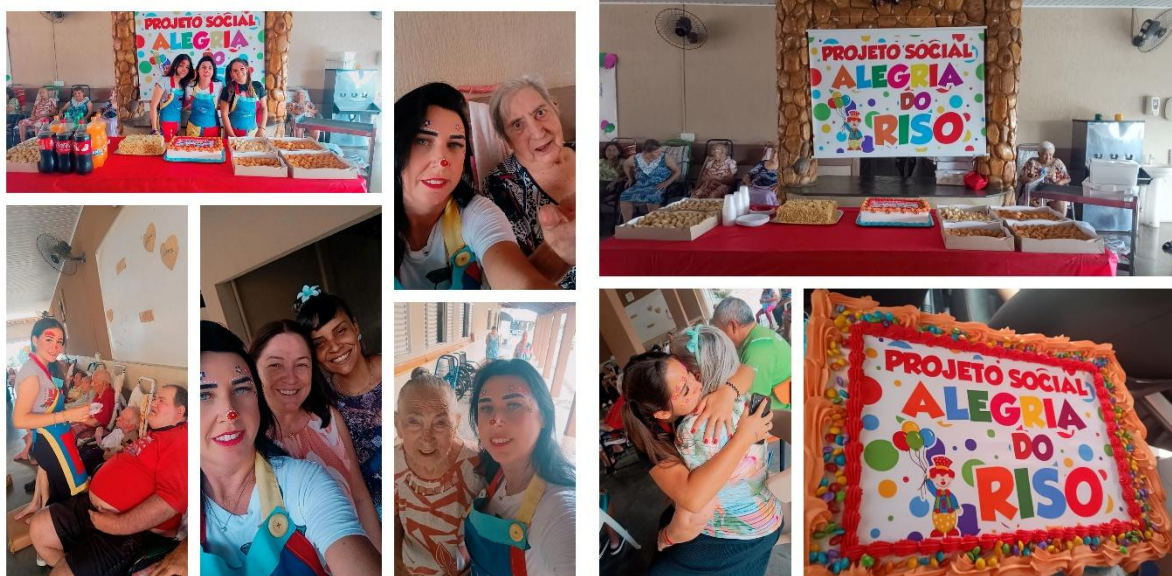
d) Atividade: Integração Comunitária – Lanche Especial e interação com Voluntários do Templo Luz Universal Joaquim de Caridade